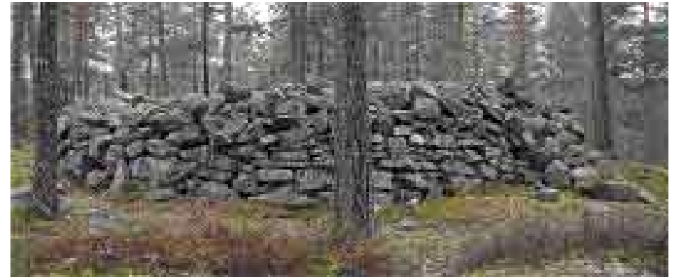
Pronssikautinen hautaröykkiö Paimion Penimäestä.

Paimion Penimäessä (kuva) on raunion reunana noin metrin korkuinen kivistä ladottu muuri. Sauvon Ristniemessä on tutkittu suurehko raunio, jossa on kolme kehää.